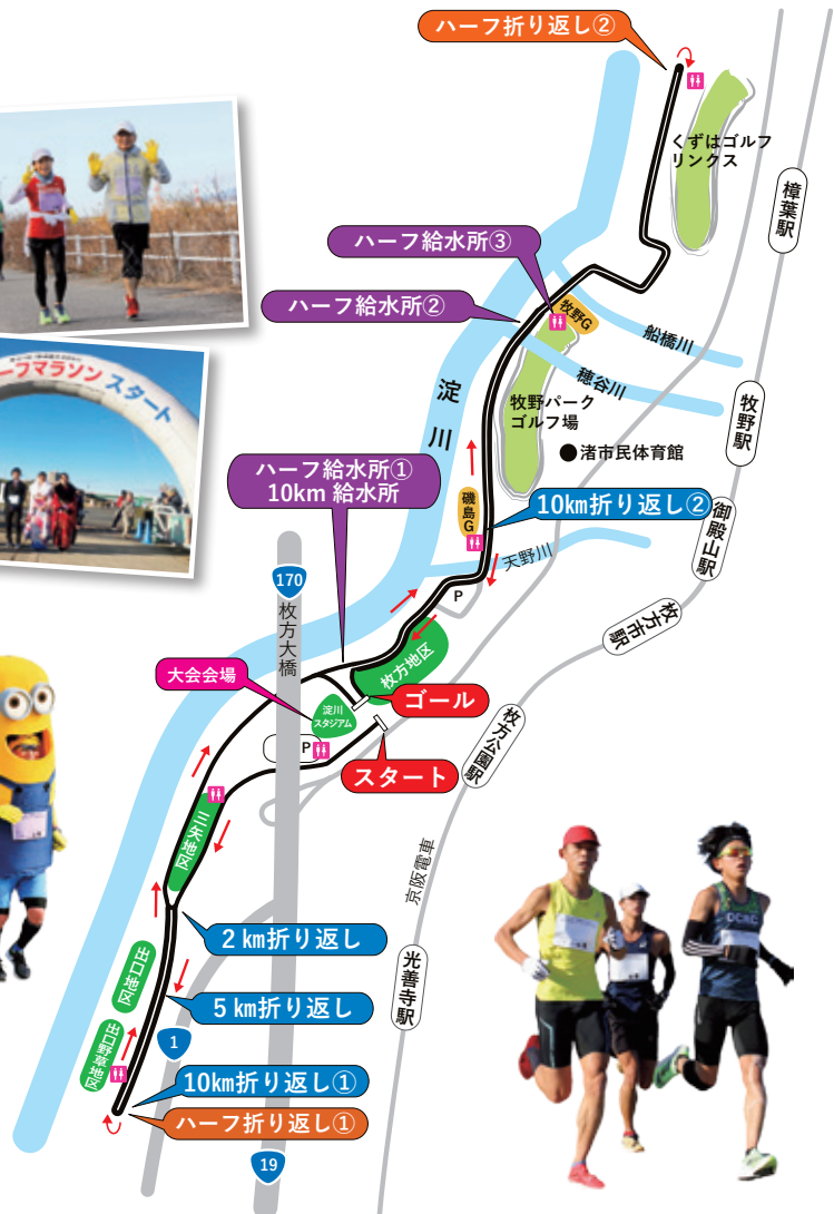
※コースは一部変更になる場合があります。